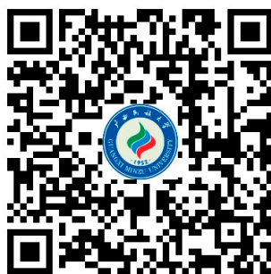
2026年全区档案班培训费

扫描下方二维码快速链接到广西民族大学收费平台的登录界面，输入“姓名”、“手机号”、“工作单位”，选定缴费金额，核对金额无误后可按系统提示完成缴费操作。（请与本单位财务部门确认缴费是否需要使用公务卡）